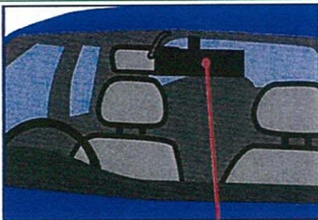
ドライブレコーダー